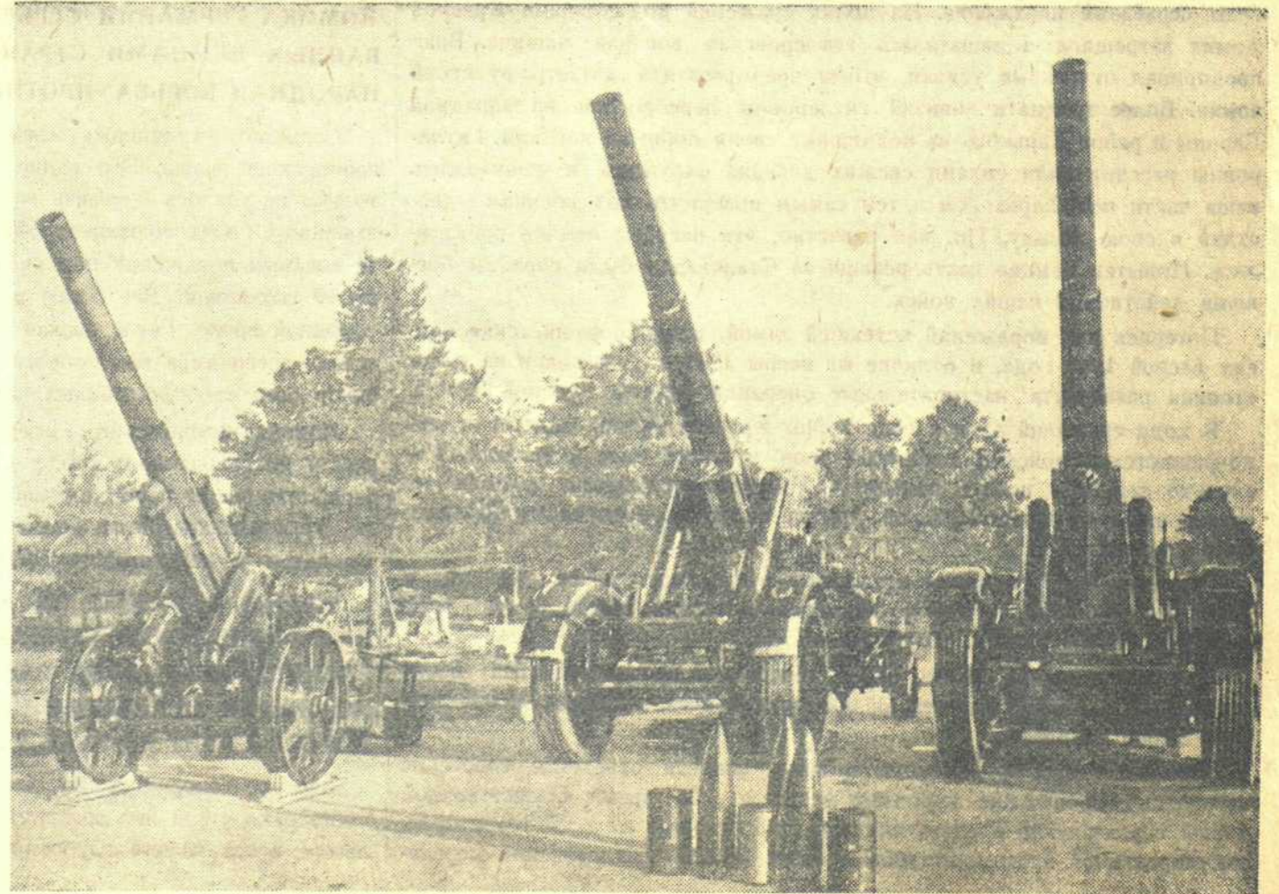
Немецкая дальняя артиллерия.